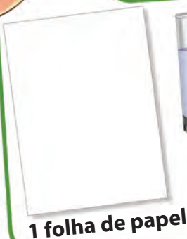
1 folha de papel